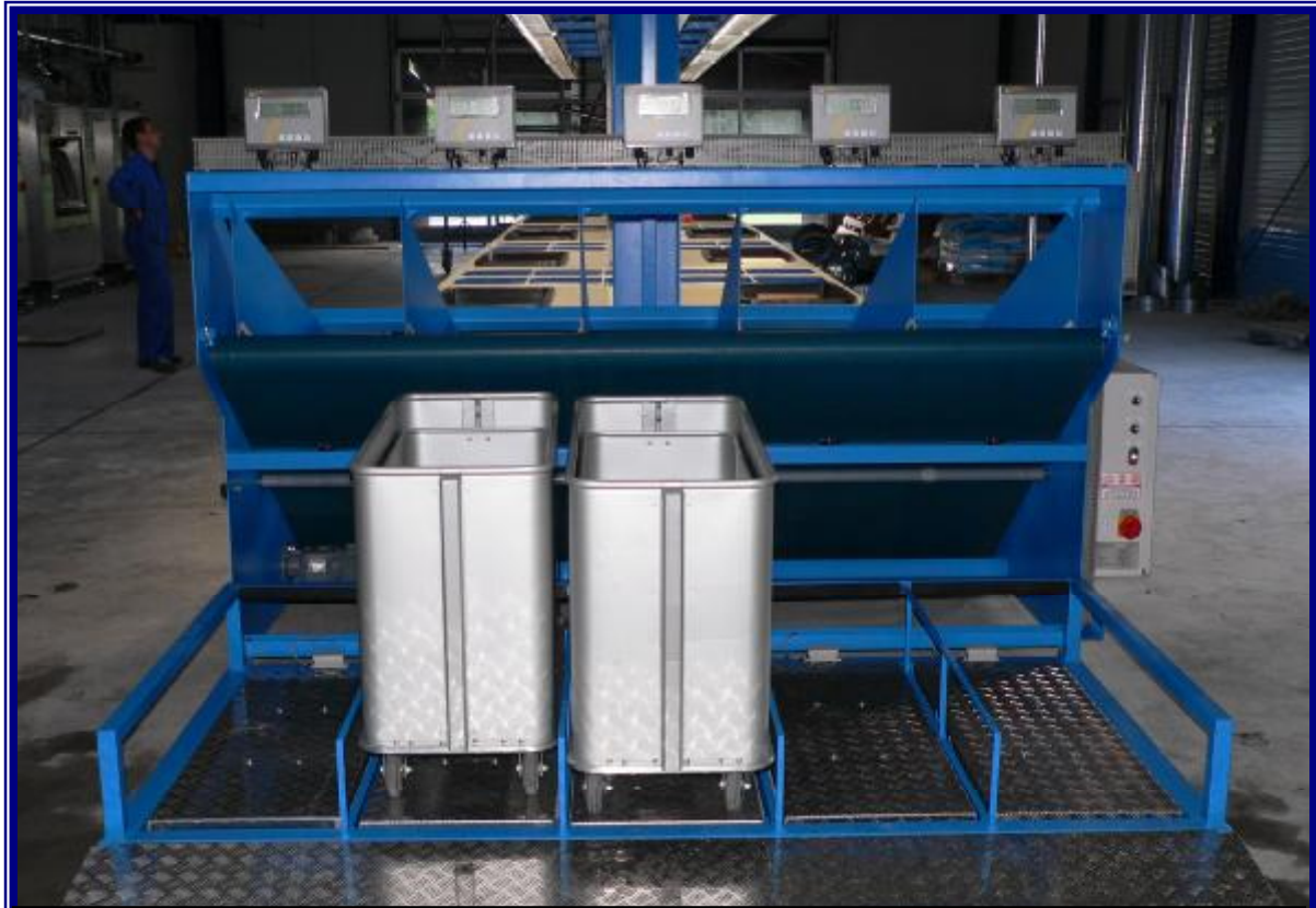
Abförderband zur zentralen Beladung von Wäschewagen, 5 Bodenwaagen