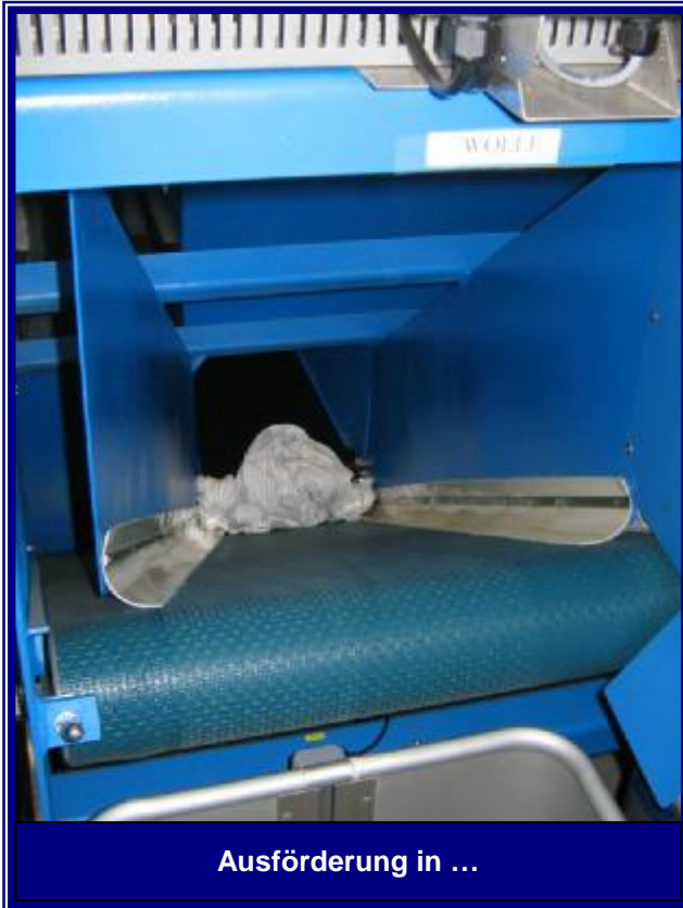
Ausförderung in ...