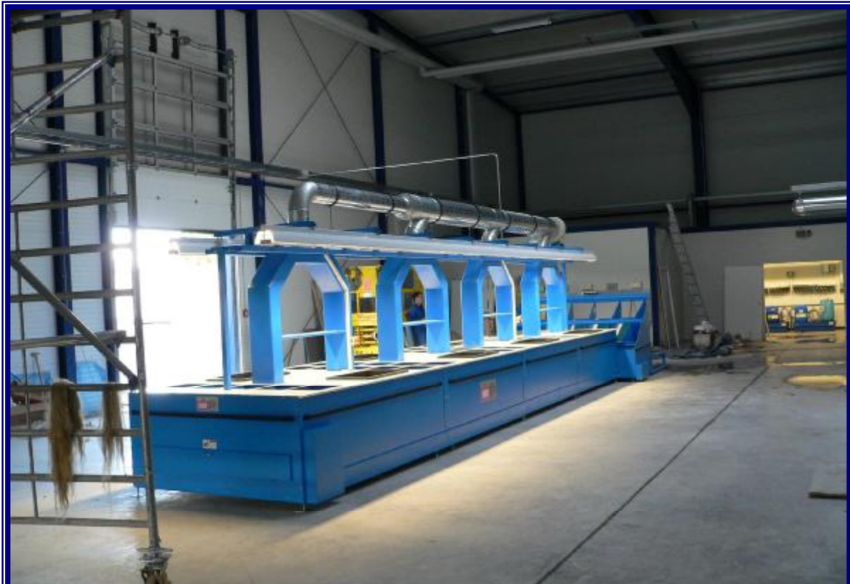
NWT-Sortier-Anlage für Schmutzwäsche mit 8 Arbeitsplätzen und 5 Sortierkriterien