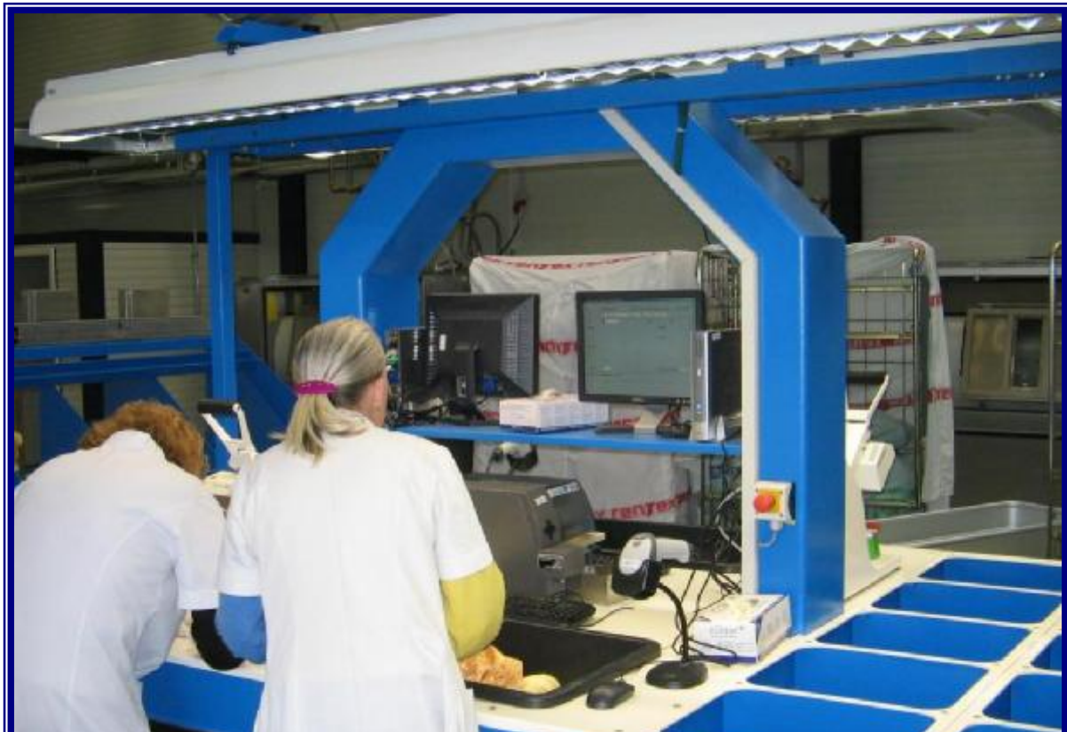
Arbeitsplätze mit Stellflächen für Rechner, Monitore, Patcher, Dokumentenablagen etc.