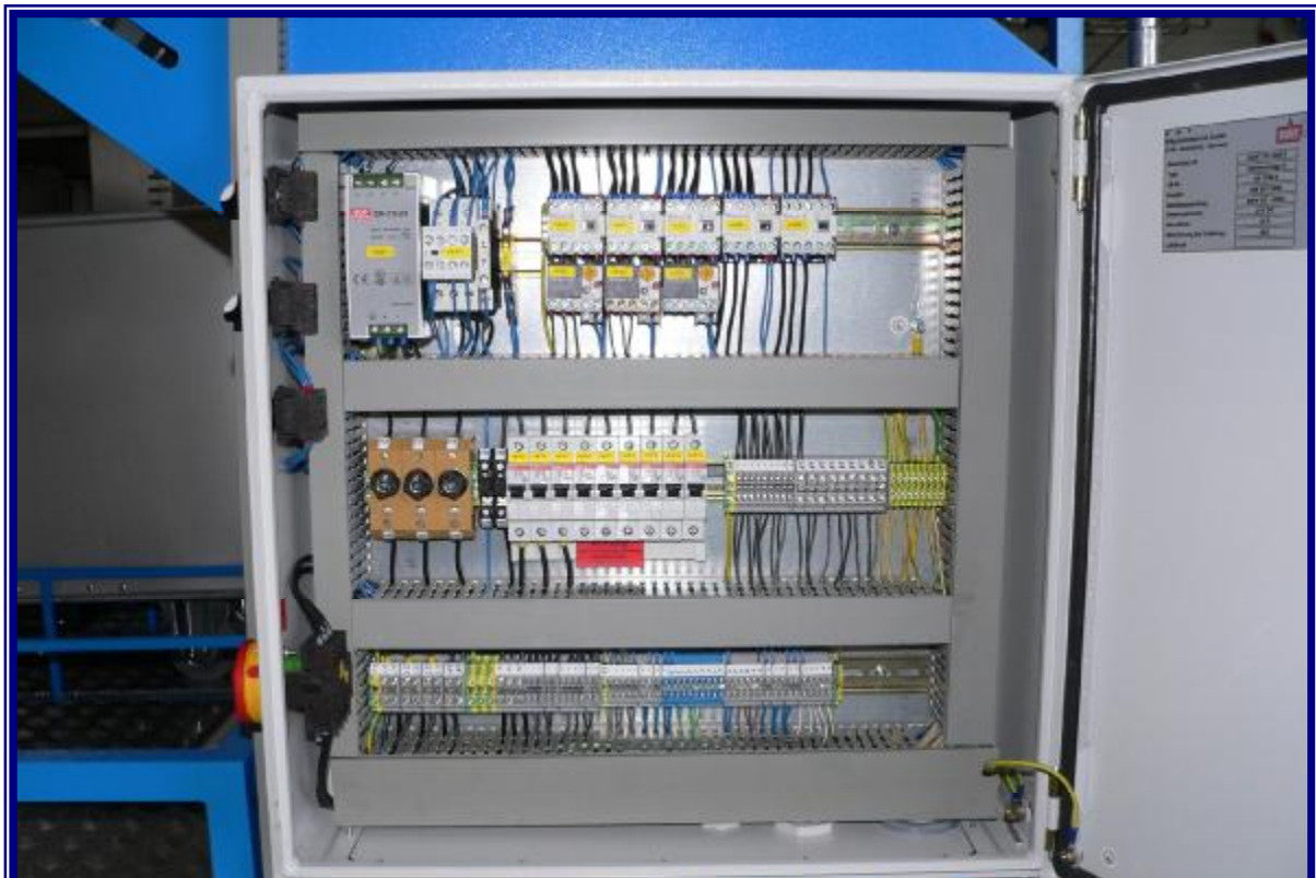
E-Kasten seitlich vom Steigförderband mit Hauptschalter, Stromversorgung zu den einzelnen Arbeitsplätzen, Kabelführungen für EDV-Leitungen